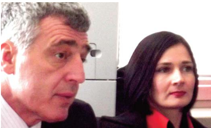
Demokratski dijalog je moćno oružje grupe

N acionalni demokratski institut iz Vašingtona, u maju 2010. godine, organizovao je posjetu Sjedinjenim Američkim Državama delegacije parlamentaraca iz Parlamentarne skupštine BiH, Parlamenta Federacije BiH i Narodne skupštine Republike Srpske. Odmah po okončanju posjete nastala je Demokratska inicijativa za Evropu - neformalna grupa koja razmjenjuje mišljenja i usaglašava stavove o bitnim i aktuelnim pitanjima na putu Bosne i Hercegovine ka evroatlantskim integracijama, poštujući demokratske principe uvažavanja i pronalaženja rješenja postizanjem kompromisa. Nakon jednogodišnjeg rada na izmjenama Izbornog zakona BiH i Kodeksa ponašanja političkih partija u izornoj kampanji, neformalna grupa se priključila inicijativi za zaštitu uzbunjivača i zajedno sa uzbunjivačima, predstavnicima Agencije za prevenciju korupcije i koordinaciju borbe protiv korupcije predstavnicima Centra za odgovornu demokratiju Luna, čine okosnicu šire neformalne grupe koja zagovara donošenje Zakona za zaštitu uzbunjivača.