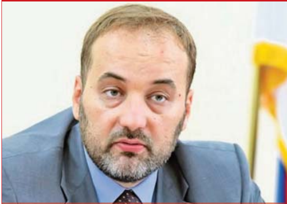
Saša Janković , ombudsman Republike Srbije

Legalan status uzbunjivača treba biti osnov za zaštitu