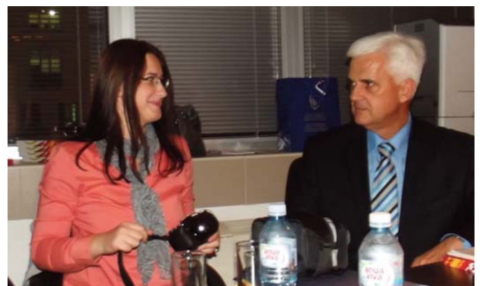
Do informacija se dolazi brzo i iz prve ruke

Nakon posjete Beogradu, grupa razmatra mogućnost organizovanja konferencije u Sarajevu na koju bi bili pozvani partneri iz Beograda, ali i drugi predstavnici iz regiona koji se zalažu za zaštitu uzbunjivača u svojim državama.