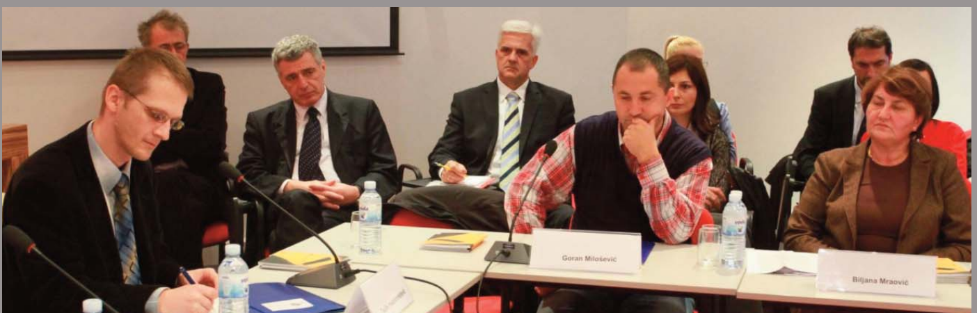
Sa okruglog stola je izvještavala i državna televizija u Srbiji

Za članove delegacije iz BiH, okrugli sto je bio izuzetno značajan jer su se upoznali sa konkretnim slučajevima uzbunjivača iz Srbije. Posebno su značajna iskustva onih koji su uprkos pritiscima bili istrajni i koji su na kraju dobili društveno priznanje za svoj doprinos.